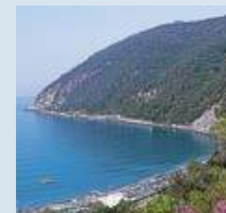
Panoramica del mare dei Poeti

• In volo verso gli Usa. Air Europa propone un'offerta volo a/r, con partenza da Malpensa per Miami da 414 euro e per New York da 454 euro, da acquistare entro il 31 maggio. Info: tel. 02 89071767, www.aireuropa.com • In nave a Barcellona. Alla scoperta della capitale catalana per il ponte del 2 giugno con Grimaldi Lines: formula nave più hotel 4 stelle, con partenza da Livorno il 28 maggio. Soggiorno di 4 giorni, con viaggio a/r in cabina per quattro persone, trasporto di auto o moto, due notti a bordo e due con prima colazione in hotel, da 247 euro a persona. Info: tel. 081 496666, www.grimaldi-touropoperator.com