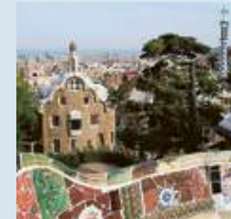
Parc Güell a Barcellona