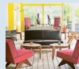
Hotel La Banane a St. Barth

• Settimana blu sul mare dei Poeti. Si dorme all'Abbadia San Giorgio, antico convento quattrocentesco, a Moneglia: sette notti, con prima colazione nel Cenatio, ex refettorio dei frati francescani, un pranzo ai Bagni La Secca o una cena al ristorante del Villa Edera e servizio di spiaggia privata, da 875 euro a persona in doppia. Info: tel. 0185 491119, www.abbadiasangiorgio.com • Formentera che passione. Es Ram, nelle più gettonate tra le isole Baleari, è formato da un gruppo di ville immerse in una pineta sul mare. Equinox propone un soggiorno di sette notti in camera doppia, da 600 euro a persona (voli e iscrizione esclusi). Info: tel. 011 8185270, www.equinox.it