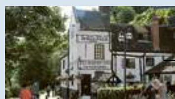
Ye Olde Trip to Jerusalem, antichissima locanda di Nottingham

Itinerari d'autore in Inghilterra, per chi cerca Robin Hood, Dylan Thomas e Agatha Christie