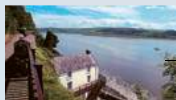
La Boathouse di Dylan Thomas a Laugharne, in Galles