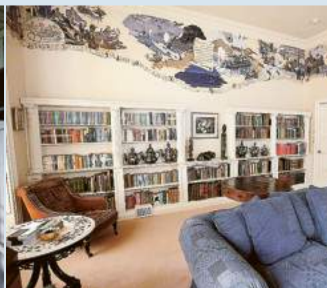
Da sinistra, il castello di Nottingham, costruito nel XVIII secolo sui resti di quello medievale; lo studio di Dylan Thomas nella Boathouse; la libreria della Greenway House di Agatha Christie