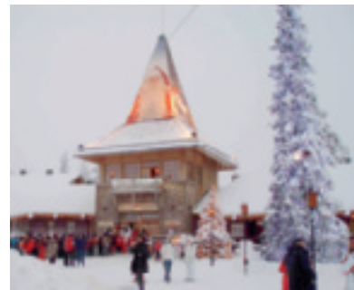
A destra la festa delle befane e dei befani a Fornovo Taro (PC); sopra il villaggio di Babbo Natale a Rovaniemi; sotto la ciaspolada della Val di Non

UN'EPIFANIA a misura di bimbo è quella proposta dall'Hotel Villa Ida (tel. 0182.690042) di Laigueglia (SV), uno dei gioielli dell'Associazione Golden Book Hotels. Al ristorante, oltre ai menu per adulti, sono disponibili quelli per bambini. Nelle camere ci sono lettini con