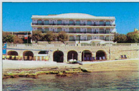
L'hotel Terminal a Santa Maria di Leuca.

PUGLIA Per una vacanza di Pasqua all'insegna della tradizione, i Caroli Hotels di Gallipoli e Santa Maria di Leuca, in provincia di Lecce, che fanno parte dell'Associazione dei Golden Book Hotels, propongono una Settimana Santa speciale. L'appuntamento è per giovedì 9 aprile a Gallipoli per una visita ai Sepolcri. Venerdì, dopo avere visitato Lecce, si può assistere a Gallipoli alla suggestiva processione del Venerdì Santo, che parte dal borgo antico e si snoda per le vie della "città nuova". La visita del borgo antico di Gallipoli è prevista per il pomeriggio di sabato, mentre la mattina è dedicata a Maglie. Domenica c'è il tempo per visitare Santa Maria di Leuca, dove si uniscono lo Ionio e l'Adriatico. La giornata prosegue con una passeggiata fino a Otranto. Lunedì, prima di partire, si assiste al rito della pietra forata nella cappella di San Vito a Calimera. Ogni anno, il giorno di Pasquet-