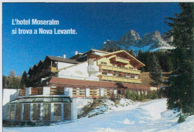
L'hotel Moseralm si trova a Nova Levante.

ALTO ADIGE Oltrepassando il lago di Carezza, in val d'Ega, Alto Adige, si arriva in un bosco innevato e, dopo un paio di chilometri, ci si trova in un pianoro dove il panorama è talmente bello che sembra una cartolina. Qui è situato l'hotel Moseralm, un quattro stelle, tanto vicino alle piste che ci si può fermare con gli sci davanti alle vetrate del centro benessere. Anzi, dopo la sauna, durante il relax, si possono vedere gli sciatori che salgono e scendono lungo i tracciati che si snodano dal Latemar e dal Catinaccio, i