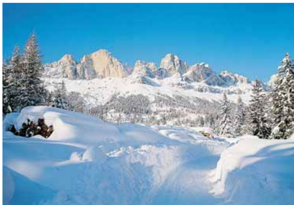
Tanta bella neve nel comprensorio del Consorzio Rosengarten-Latemar

Il Consorzio turistico Rosengarten-Latemar propone l'offerta Prima Neve, valida da dopodomani, sabato, 29 novembre al 23 dicembre prossimo. La proposta prevede quattro giorni di soggiorno e skipass al prezzo di tre; scuola di sci e noleggio attrezzatura a prezzi speciali. Il costo per un hotel tre stelle è a partire da 226 euro a persona, mentre per un hotel quattro stelle il prezzo base sale a 370 euro a persona. Chi prenota soggiorno e skipass per otto giorni ne paga solo sei. Informazioni e prenotazioni: Consorzio Turistico Rosengarten-Latemar, tel. 0471 610310 www.rosengartenlatemar.com,