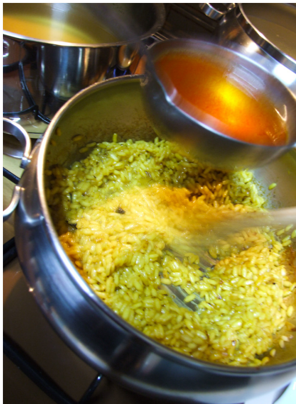
Risotto alla milanese